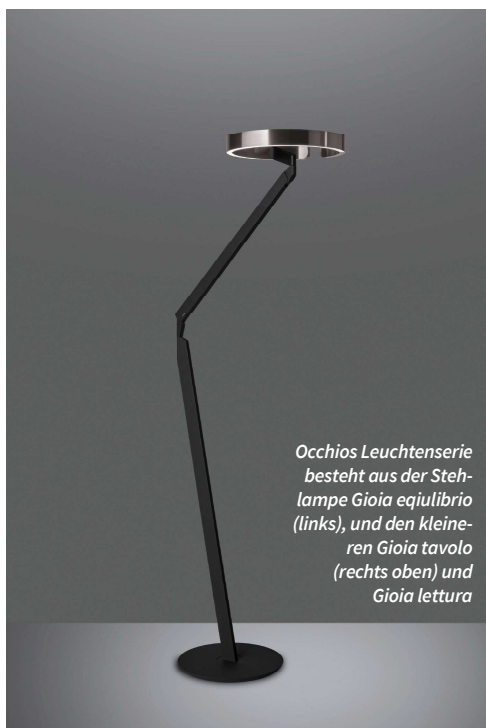
Occhios Leuchterserie besteht aus der Stehlampe Gioia equilibrio (links), und den kleineren Gioia tavolo (rechts oben) und Gioia lettura

Licht ist Leben. Stephan Koll erzählt in seiner neuesten Kolumne davon, wie sich Licht vom Selbstzweck des „Helligkeitschaffens“ zum Stilmittel zum Wohlfühlen, zum Designfaktor wandelte. Natürlich nicht, ohne an die Lichtquellen besondere Ansprüche hinsichtlich Technik und Design zu stellen.